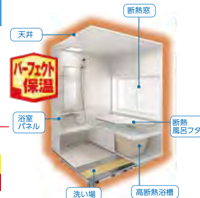
※メーカーカタログより

毎月プラン注) 特別金利 2.45% 2回目以降 月々 5,520円 (税込) ×71回(6年) ※初回のみ 6,095円 (税込)