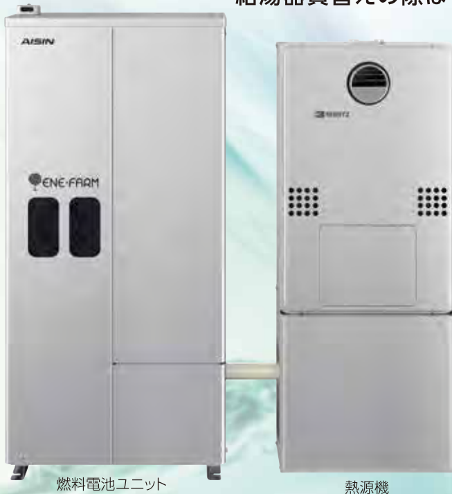
燃料電池ユニット

わが家で電気をつくり、お湯も同時につくり出す 次世代の給湯器「エネファーム」が、今だけおトクにご購入いただけます。 給湯器買替えの際はぜひご検討ください。